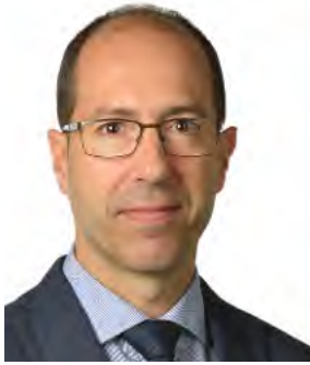
Candidato a Consejero