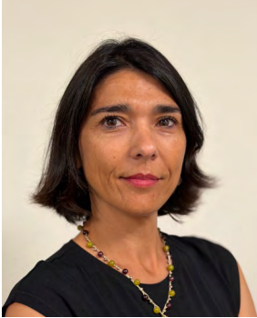
Candidato a Consejero

ADJUNTA AL SERVICIO DE INFRAESTRUCTURA-DIPUTACIÓN PROVINCIAL DE CÁCERES. SECTOR 03. ADMINISTRACIÓN LOCAL Y ENTIDADES DEPENDIENTES